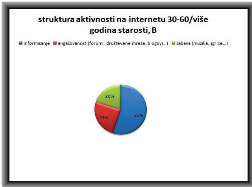
Grafika B 18-30, B 30-60: Struktura aktivnosti na internetu